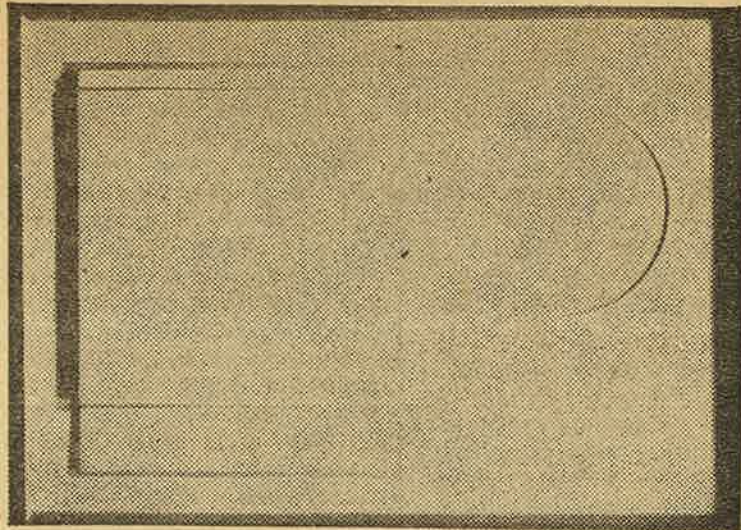
«White relief», de Ben Nicholson