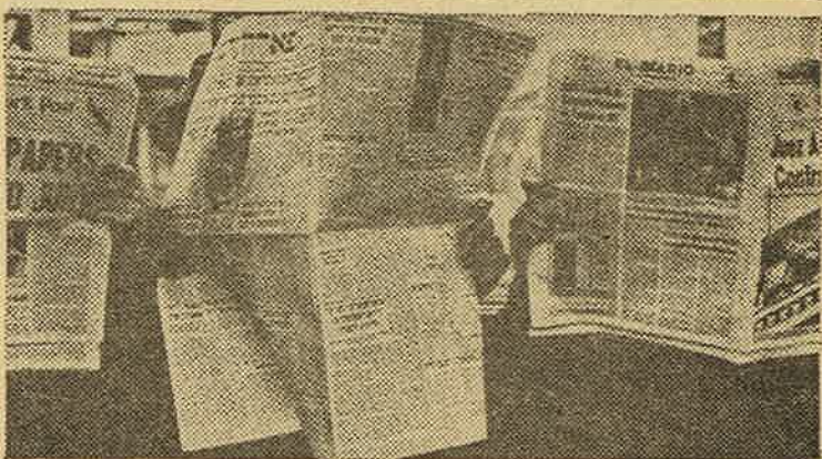
A. Muntadas: «The last ten minutes»

bre blanco. Sin abandonar el dibujo ni la figuración, por considerar que abstracción y figuración no son excluyentes, sino complementarias, el artista articula una larga relación de series pictóricas en las que funde pintura y escultura mediante la disposición del color, aplicado a partir de una noción arquitectónica del espacio. Con una nutrida muestra, el gran artista británico refleja su personal concepción de la pintura en la madrileña galería Ynguanzo.